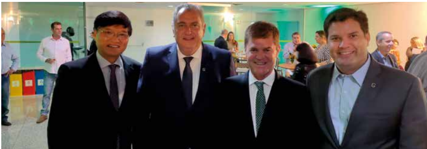
FAEMG está entre as entidades parceiras da Girolando

Convênio ICM nº 35/77. O pedido foi atendido em julho de 2022. Assim, passam a ser documentos de comprovação do controle de genealogia oficial para fins de isenção do ICMS, o Certificado de Controle de Genealogia e o Registro Genealógico.