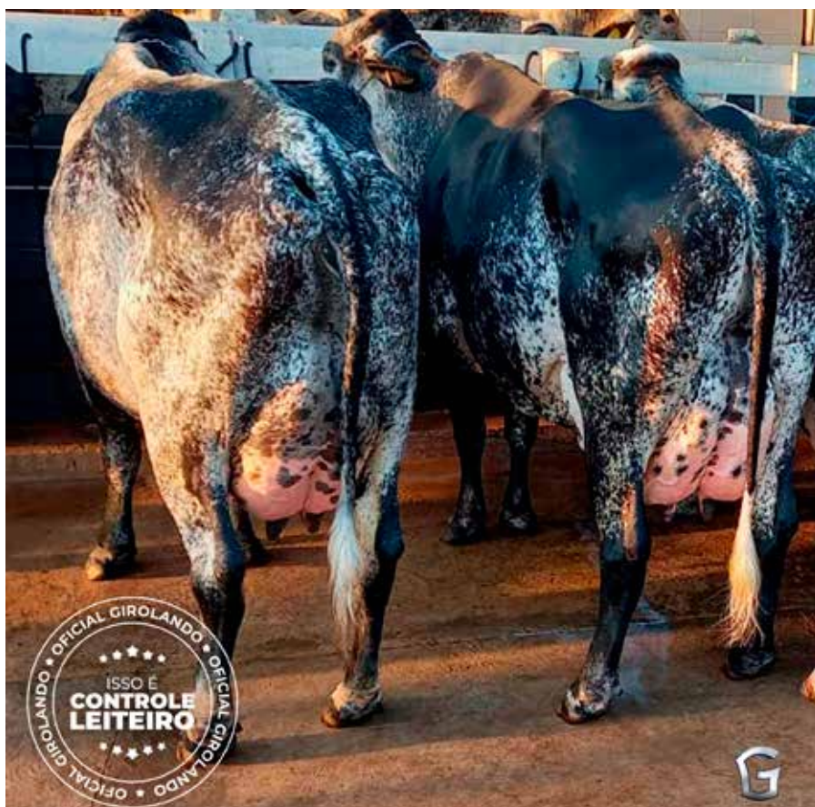
Campanha de valorização do Controle Leiteiro

pelo Mapa. Também vem sendo feita nas redes sociais campanha de incentivo ao consumo de leite.