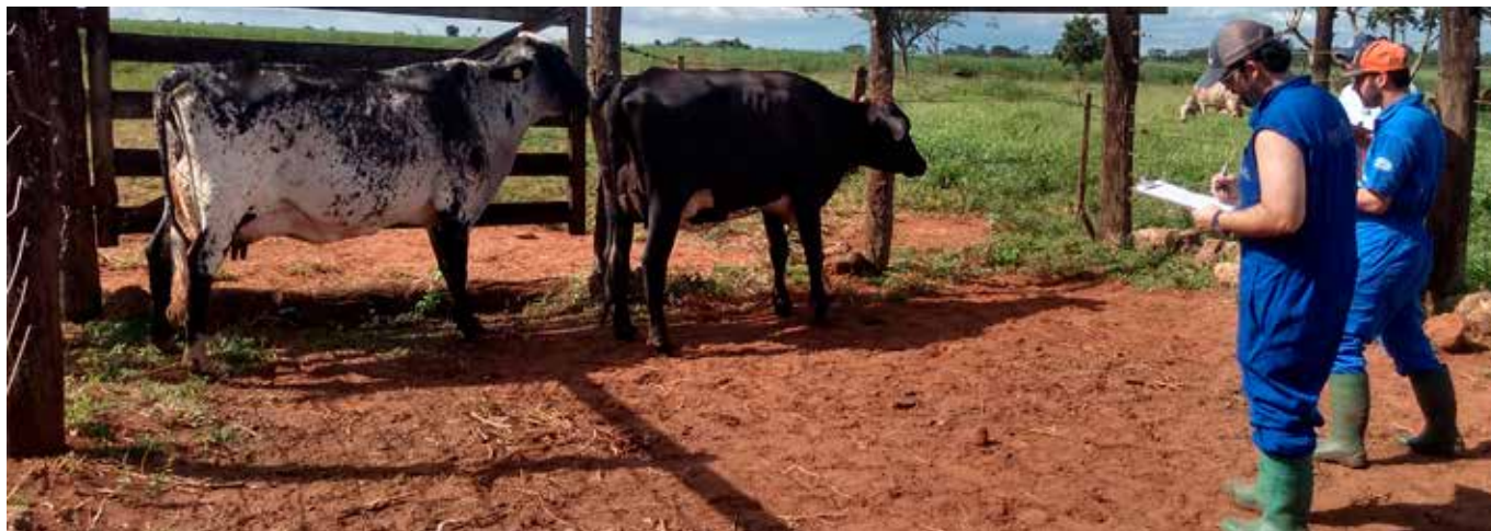
Técnicos da Girolando foram treinados para coletar informações do Sistema Linear