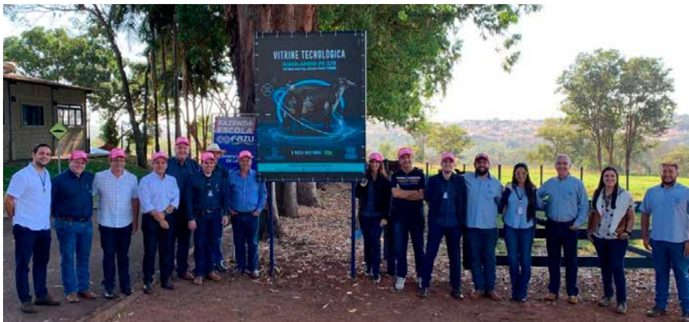
Fazu ganhou Vitrine Tecnológica Girolando

na lactação e avaliação genômica multirracial são exemplos de pesquisas realizadas.