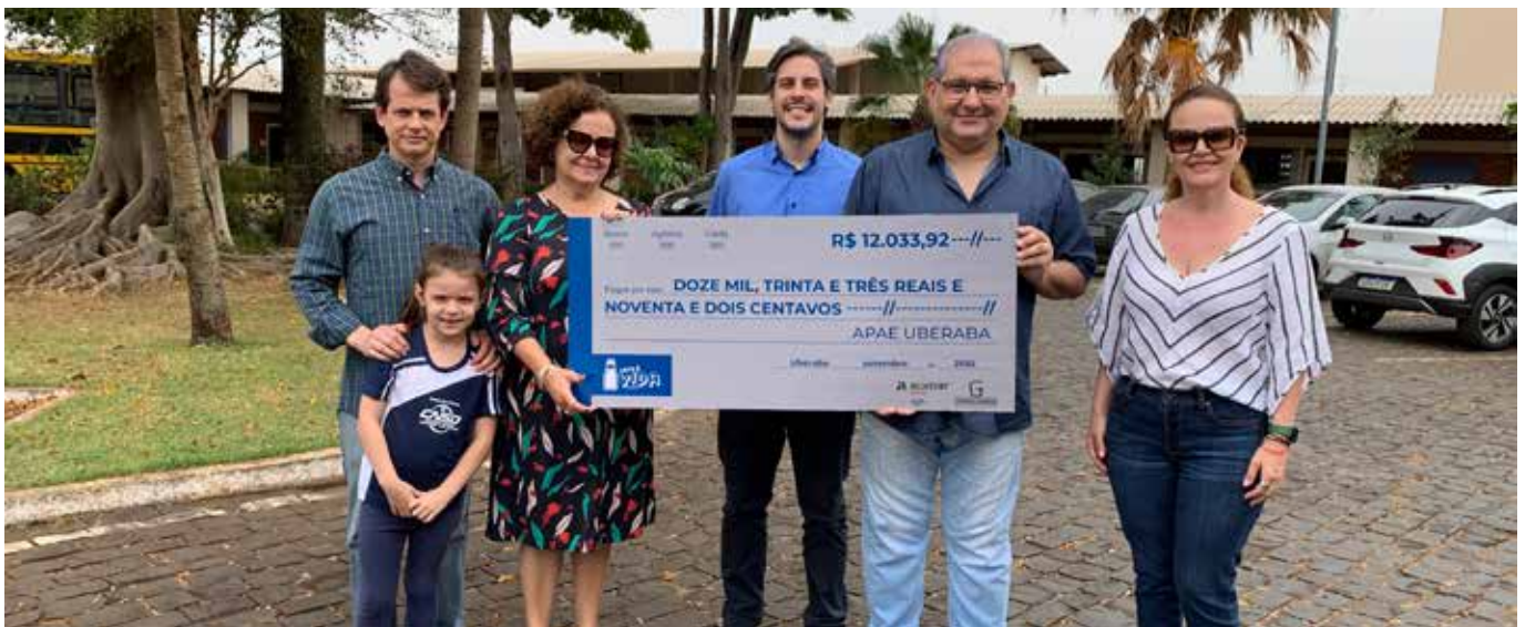
Entrega de doação do projeto Leite é Vida para a APAE de Uberaba

Realização de eventos e campanhas de marketing contribuíram para divulgação do Girolando no País