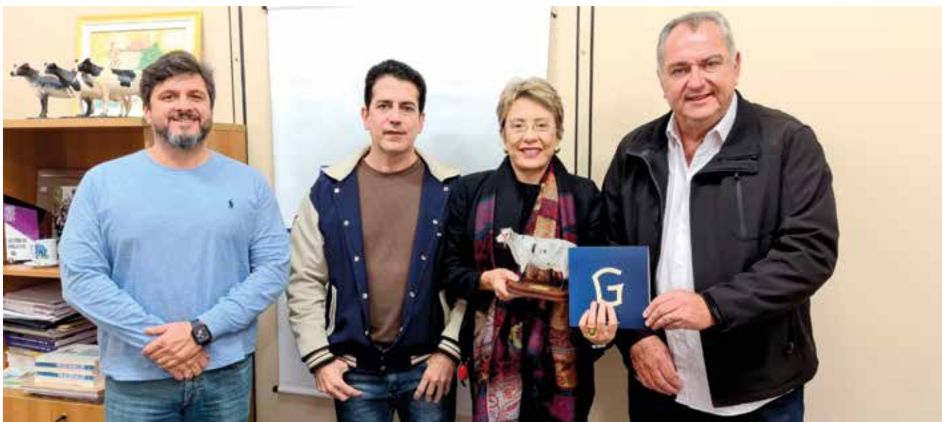
Parceria com a Embrapa Gado de Leite fortalecida durante a gestão

A Associação também participou de reuniões promovidas pela CNA e Câmara Setorial do Leite para deliberações sobre o mercado leiteiro e previsibilidade de preços do leite. A Girolando passou a integrar o Grupo de Inteligência Setorial de Uberaba (GIS-Agro), voltado para as instituições e empresas que fazem parte do Parque Tecnológico de Uberaba. O grupo tem como objetivo compartilhar ideias entre as instituições/empresas, construir projetos e buscar novas oportunidades, além de promover a integração do agronegócio com os setores de Tecnologia da Informação e Ensino Acadêmico.